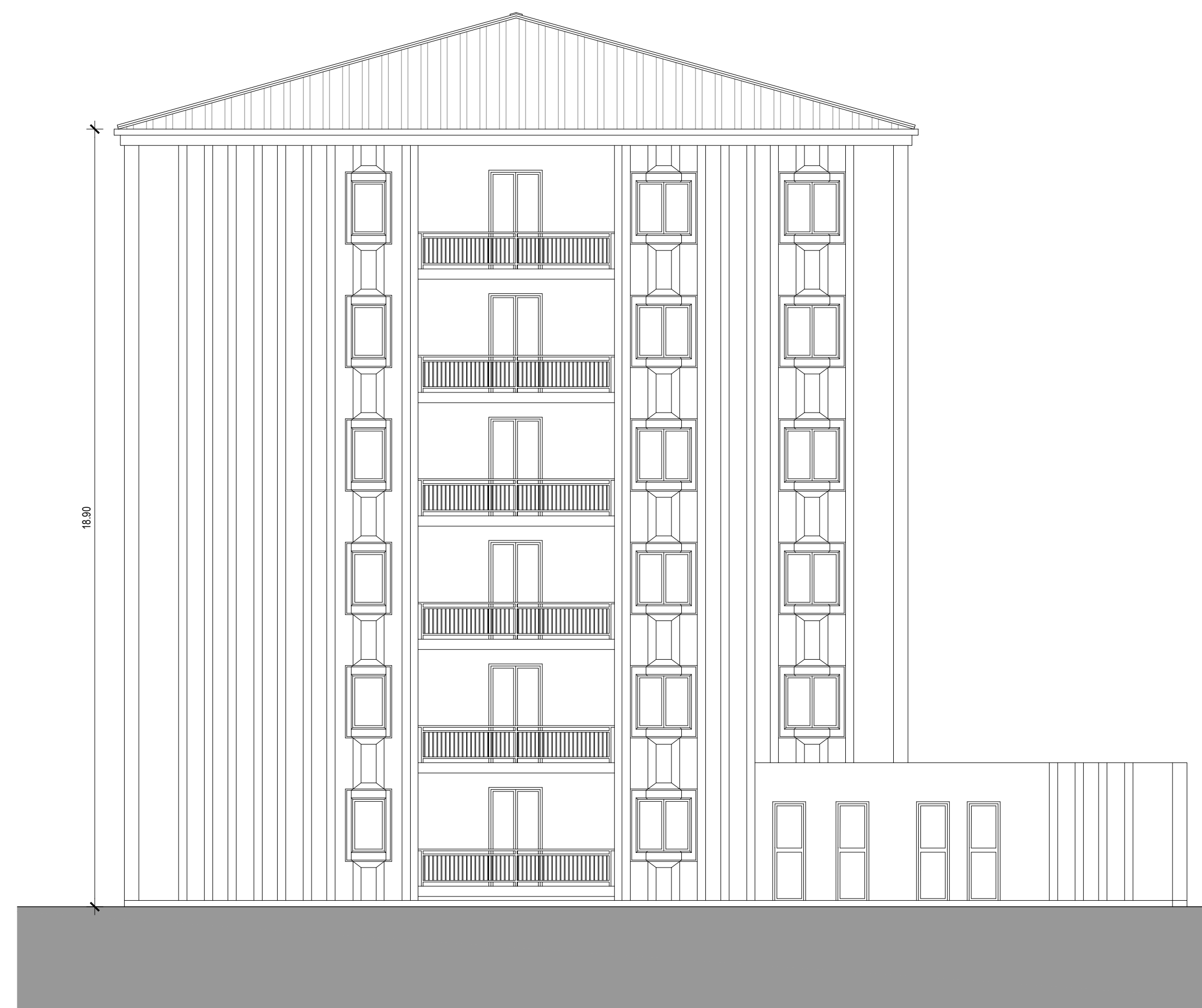
PROSPETTO OVEST SCALA 1:100