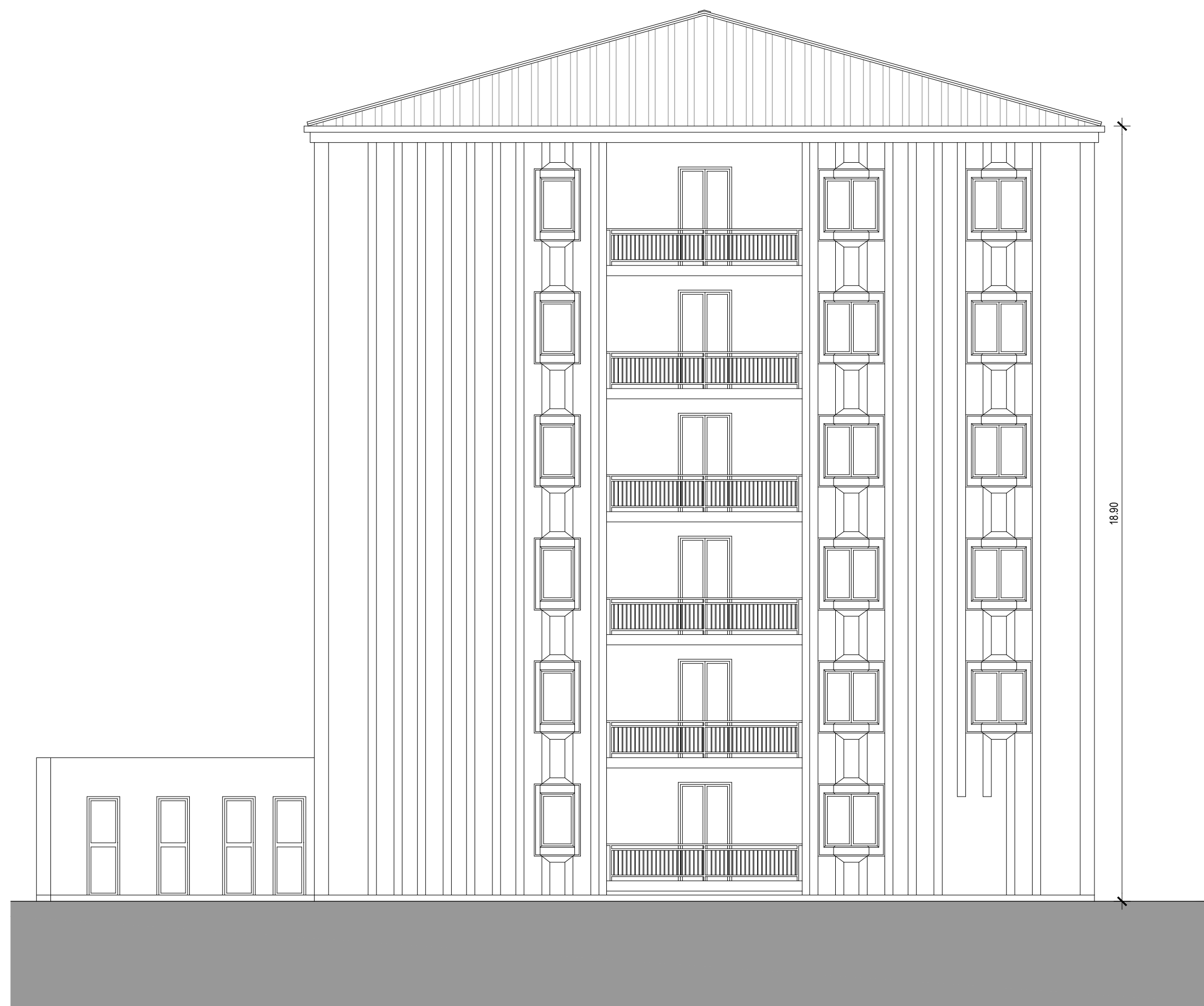
PROSPETTO EST SCALA 1:100