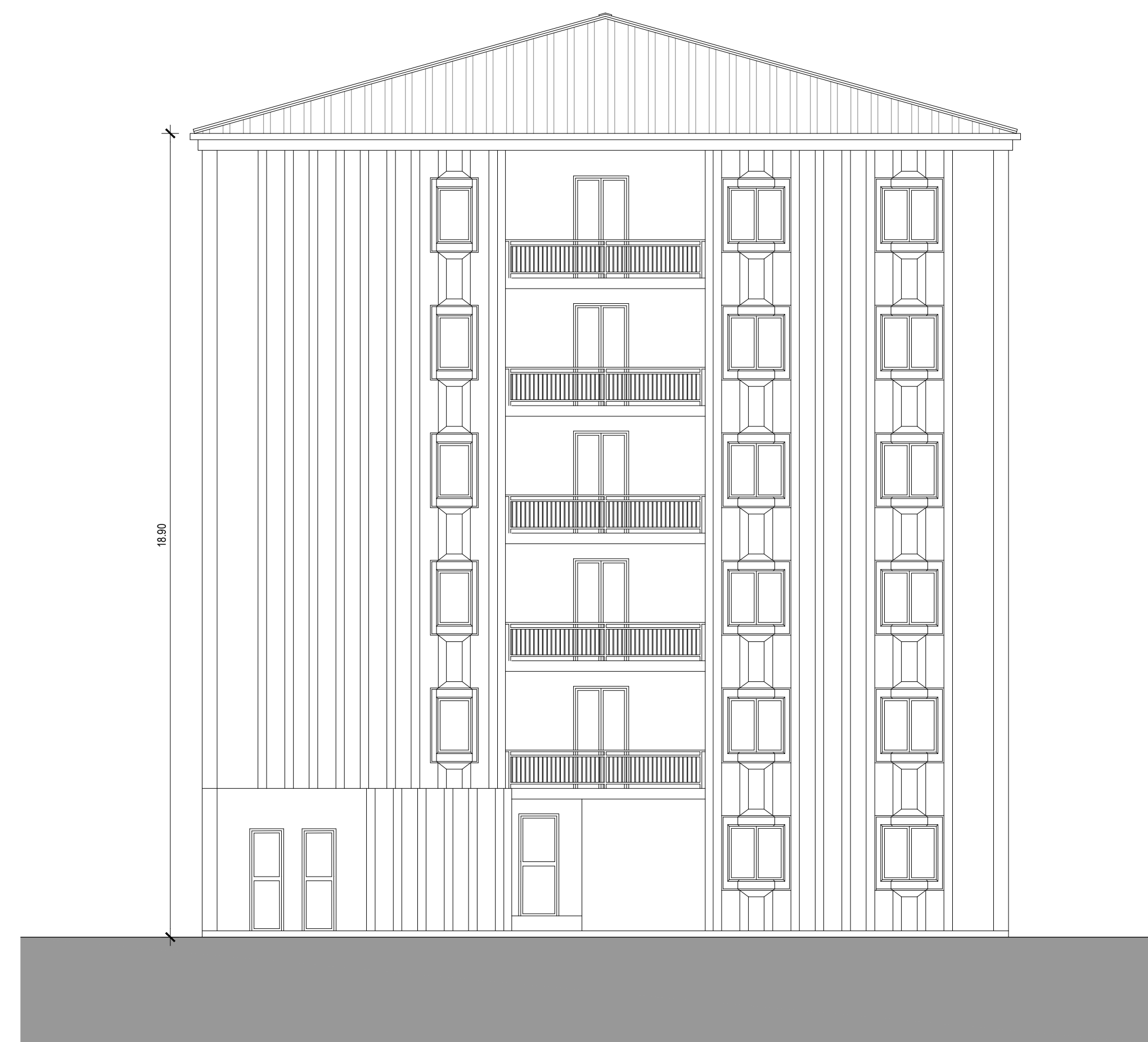
PROSPETTO SUD SCALA 1:100