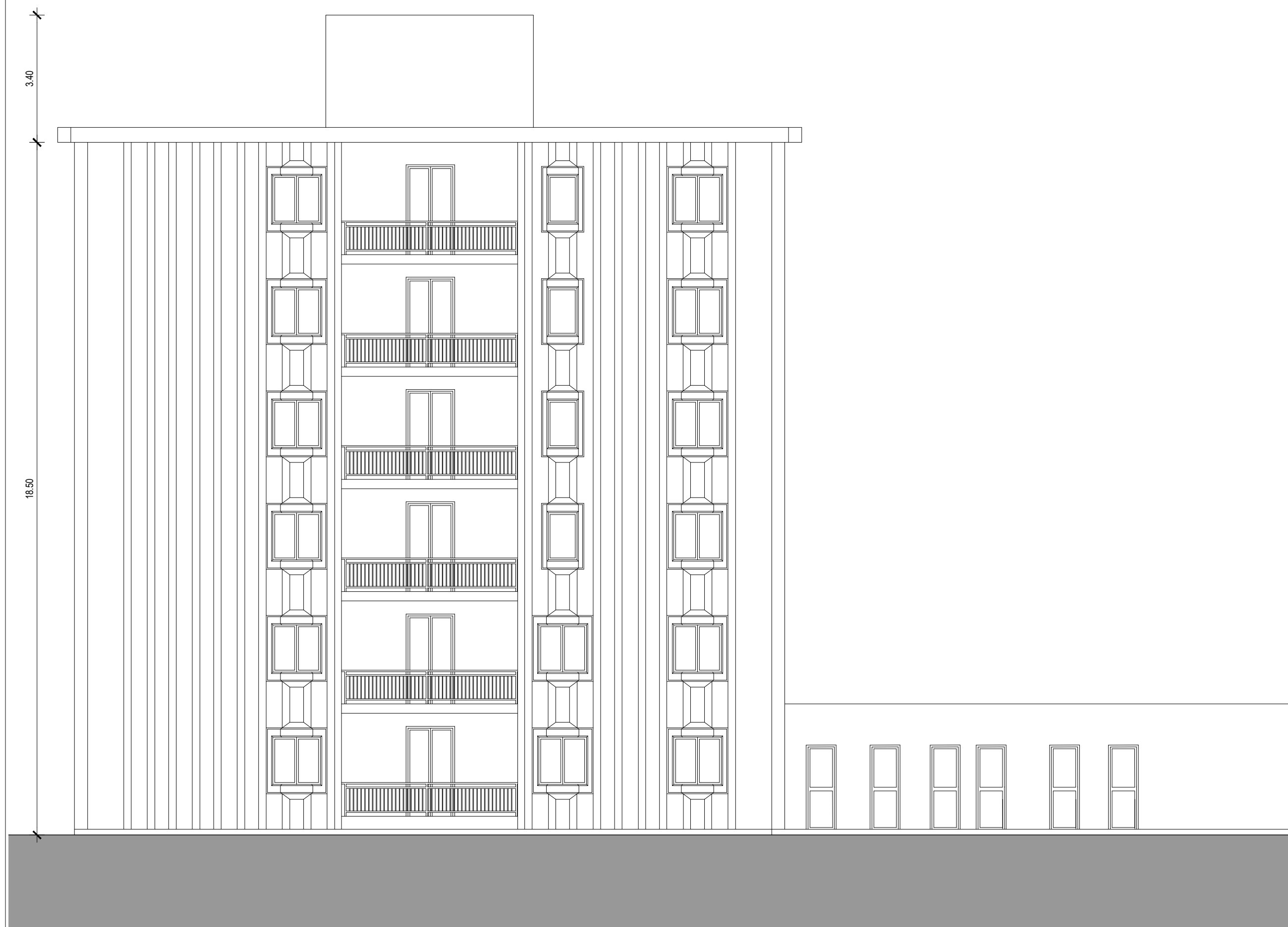
PROSPETTO EST SCALA 1:100