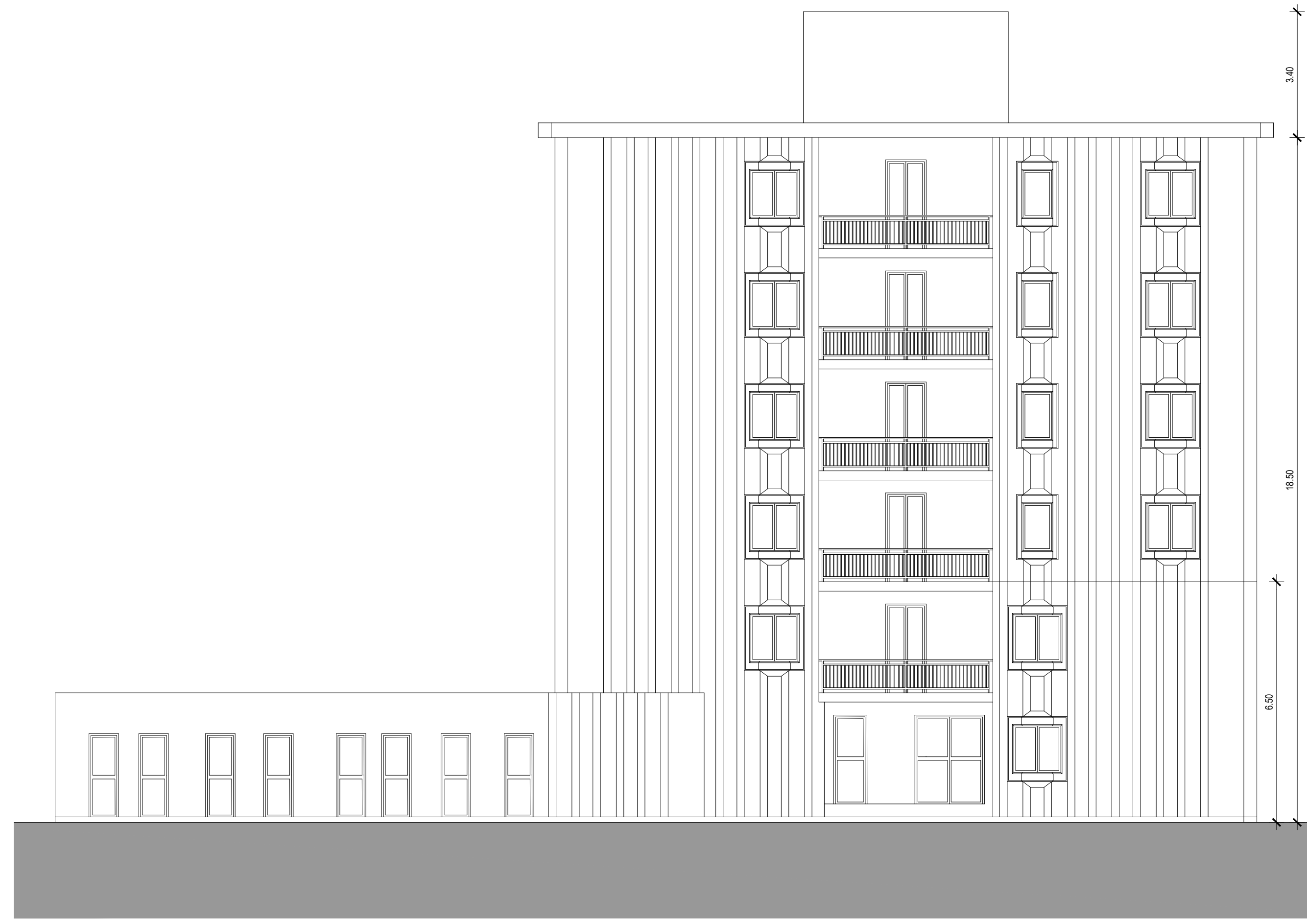
PROSPETTO OVEST SCALA 1:100