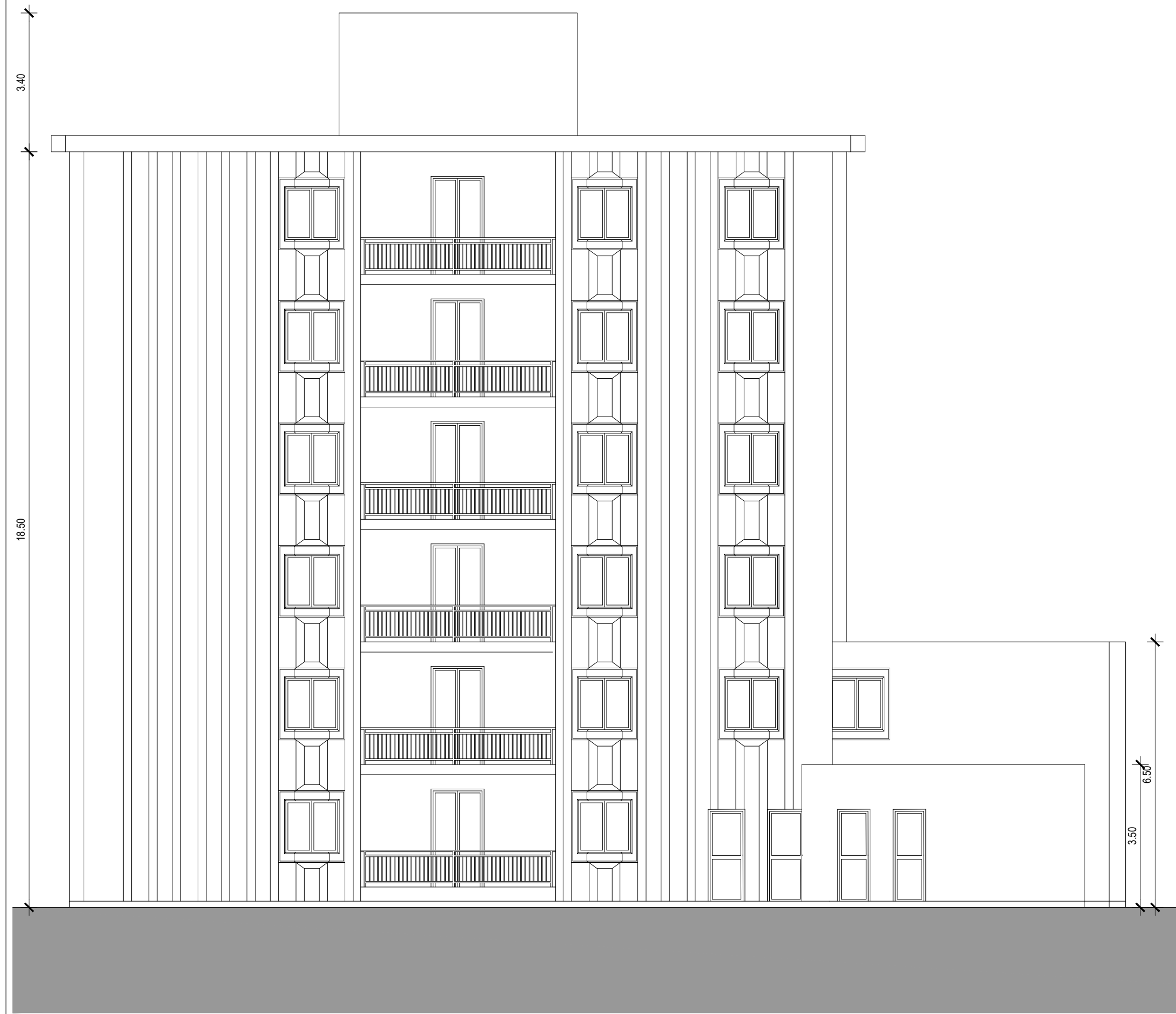
PROSPETTO NORD SCALA 1:100