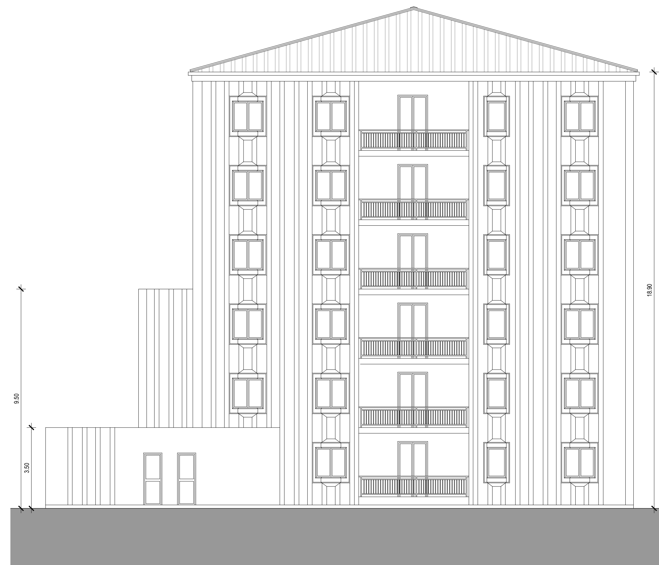
PROSPETTO OVEST SCALA 1:100