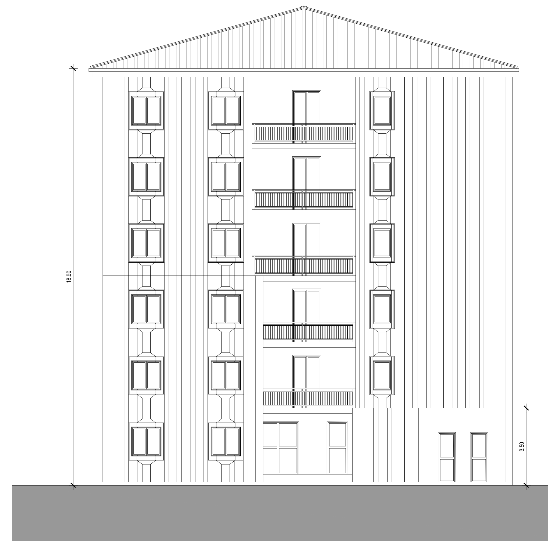
PROSPETTO NORD SCALA 1:100