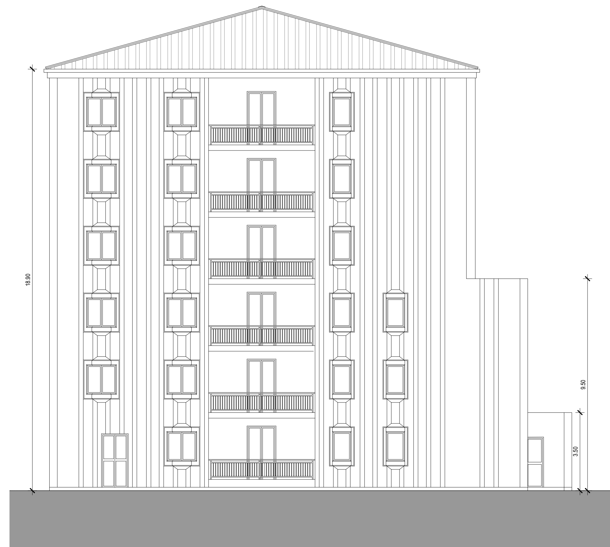
PROSPETTO EST SCALA 1:100