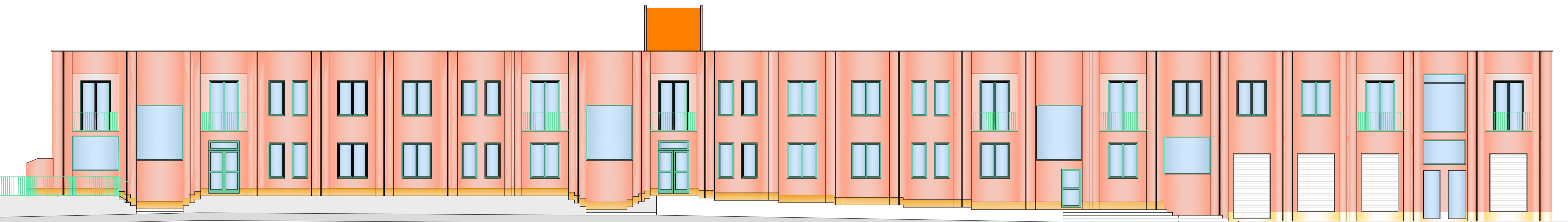
PROSPETTO SUD MODIFICHE