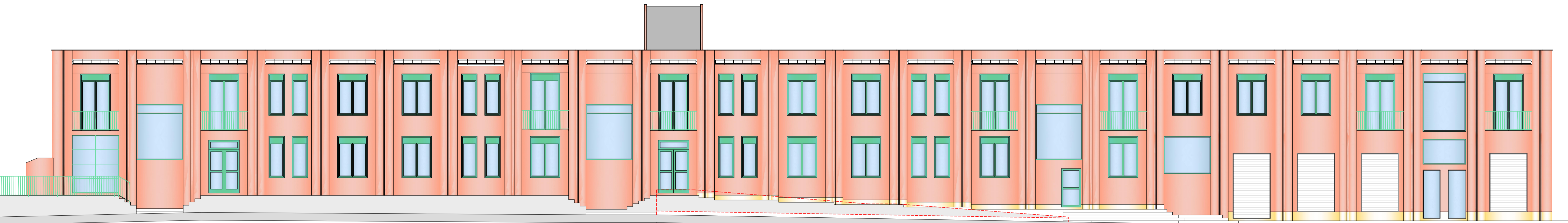
PROSPETTO SUD STATO DI FATTO